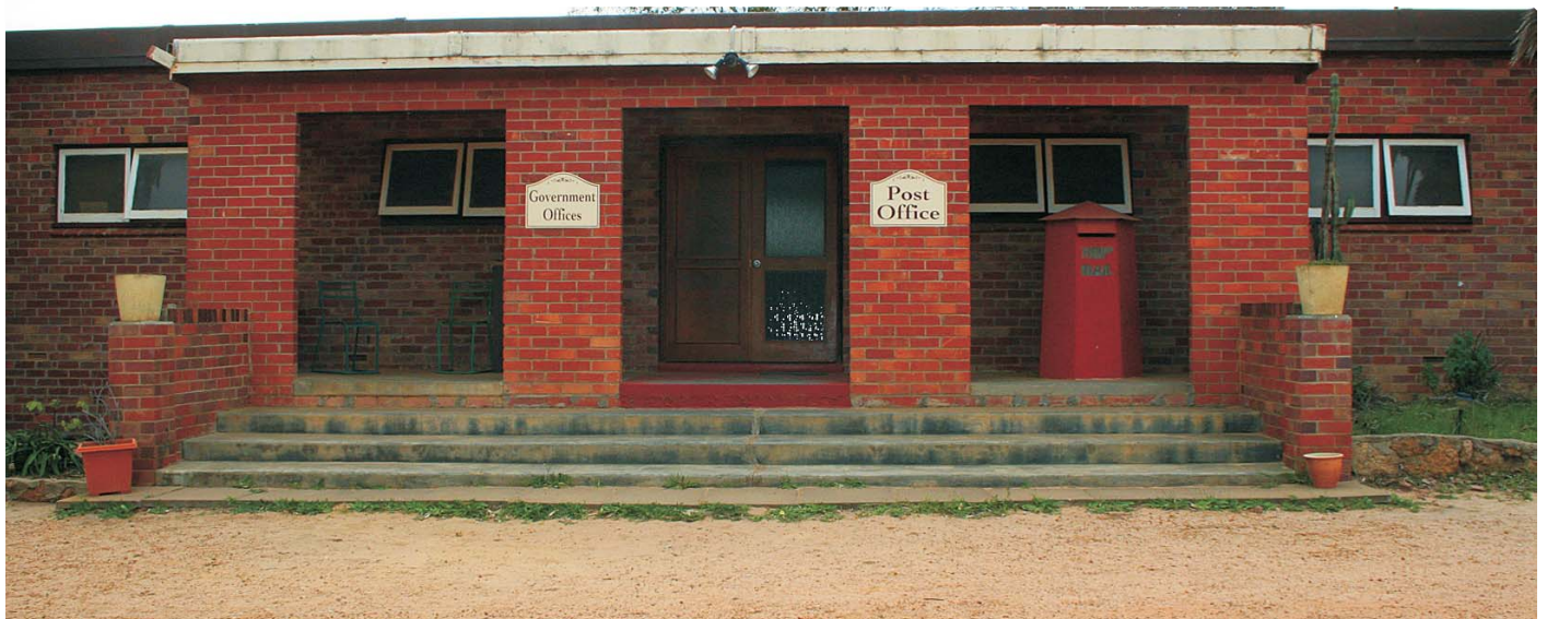
Regierungsstelle und Postamt

Eine Steuer- oder Wehrpflicht existiert derzeit in PHR nicht. Mit Wirkung vom 1. Oktober 2005 ist die lang diskutierte Verfassung der PHR mit fürstlichem Dekret in Kraft getreten. Veröffentlicht wurde die Verfassung durch den Fürsten im April 2006. 2005 wurden der Fürst und die Fürstin zu „Kentucky Colonels“ für ihre zahlreichen Verdienste ernannt. Die Auszeichnung wird durch den Gouverneur des US-Bundesstaates Kentucky an Personen vergeben, die sich besonders verdient gemacht haben. Die Auszeichnung ist eine der höchsten zivilen Auszeichnungen Kentuckys.