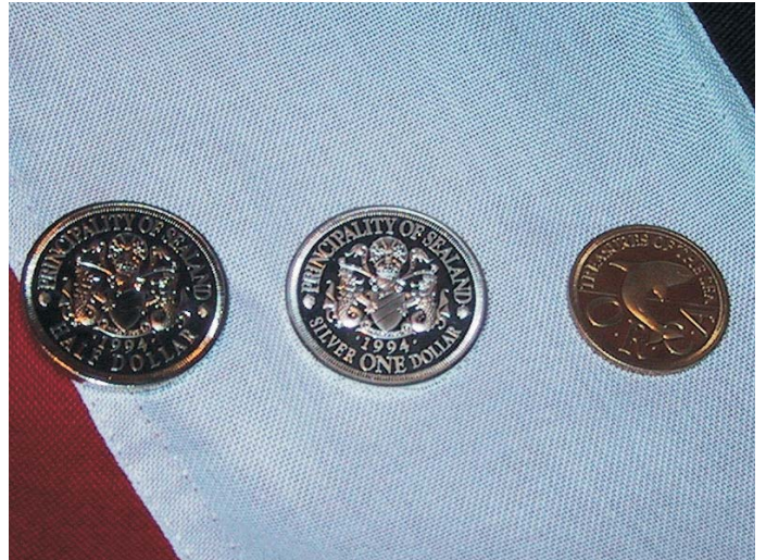
Von links: Half Dollar, Silver One Dollar, Quarter Dollar

hohen Anteil an wertvollen Metallen aufweisen, haben sie unter Münzsammlern durchaus einen Wert. In den frühen 1990er Jahren produzierte auch die Exilregierung eine Münze mit dem Konterfei des Premierministers Seiger.